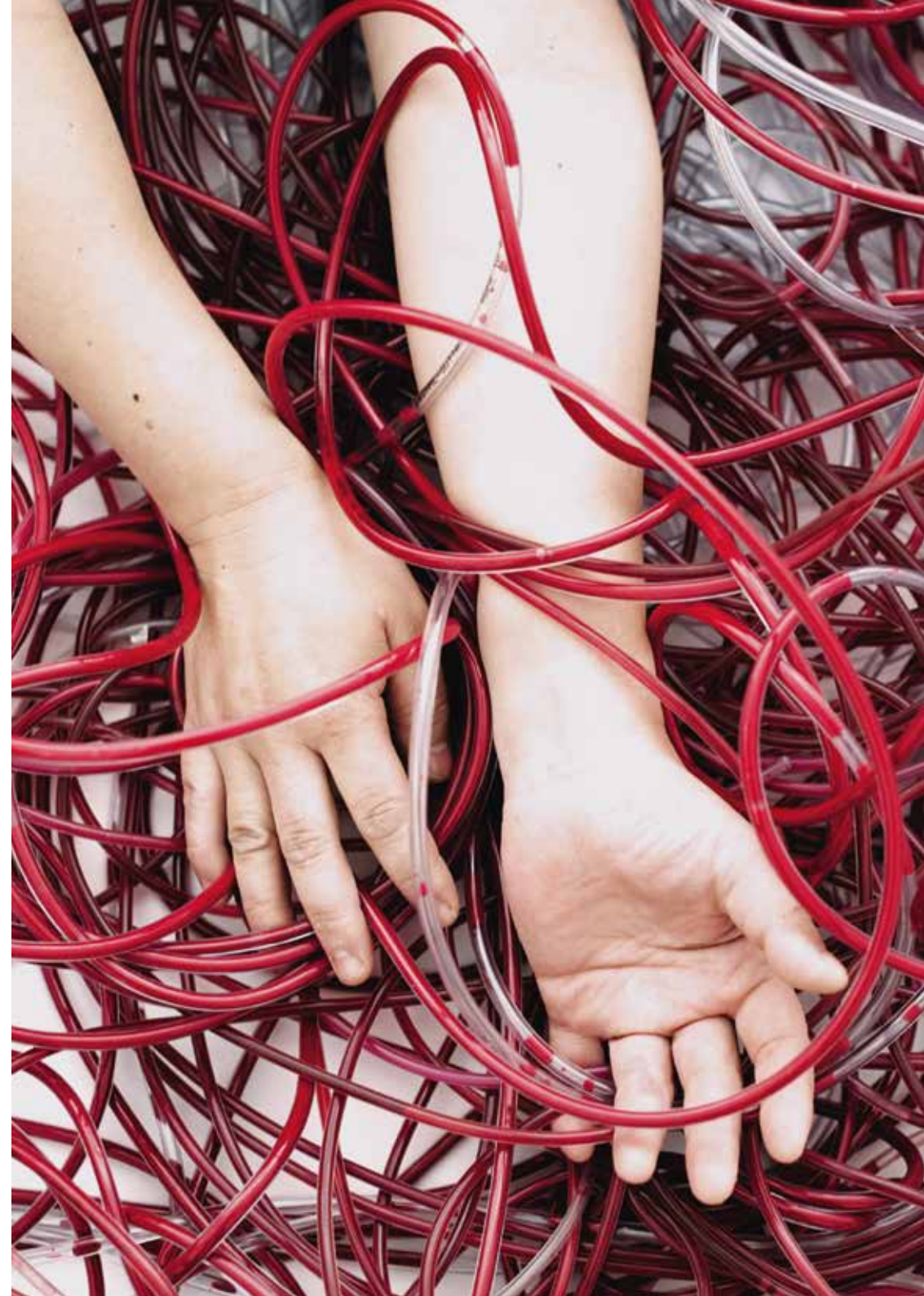
[28 & 29] Chiharu Shiota Wall / Wand 2010 Video, Loop, 3:39 Min.