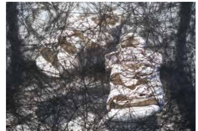
→ Chiharu Shiota State of Being (Children's Shoes) 2012 Metallrahmen, alte Kinderschuhe / metal frame, used children's shoes

Nous sommes là en présence d'images métaphoriques pour des histoires vécues et personnelles, tissées dans un espace qui les rend irréelles. Comme les images d'un rêve qui nous échappent dès que l'instant où l'on se réveille. Ne restent alors plus que des traces dans l'espace, des toiles dans lesquelles sont pris nos histoires, nos rêves et nos souvenirs. Des fils traversent l'espace tout en accaparant nos corps, nos vêtements et autres objets. Shiota crée ainsi un espace mémoriel dans lequel nous sommes proches des choses sans pouvoir les saisir.